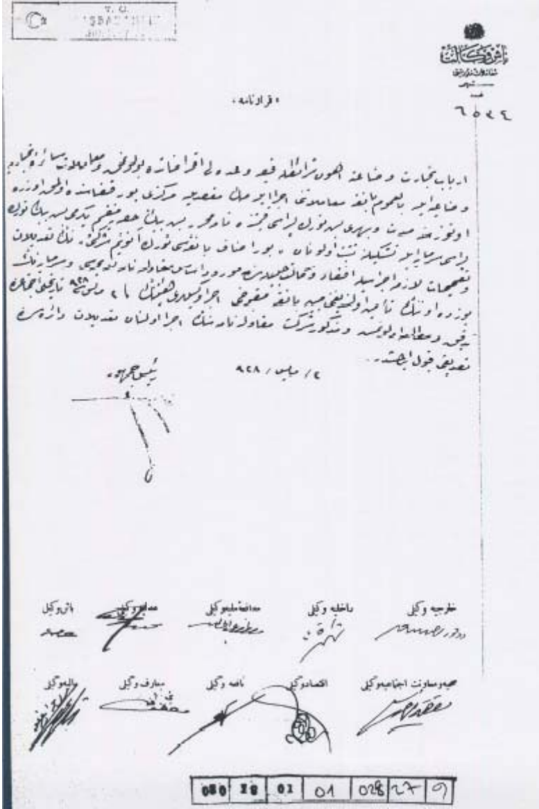
EK 4: Bor Esnaf Bankası TAŞ'nin Tüzüğünü Onaylayan Bakanlar Kurulu Kararı, B.C.A., 30.18.1.1. / 28.27.9.